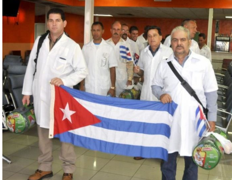
Des médecins cubains et vénézuéliens viennent en renfort en Italie

l'arrêt de l'appareil productif nécessaire à notre vie, n'en déplaise aux écologistes politiques décroissants qui se taisent honteusement aujourd'hui ?