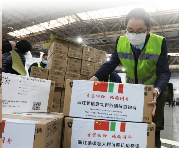
La Chine envoie des missions sanitaires permettant d'aider sans contrepartie les pays les plus touchés: Italie, Tunisie, ...