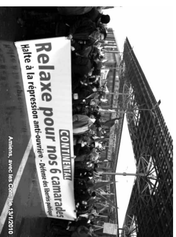
Amiens, avec les Cordis, 13/1/2010