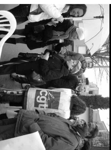
Des militantes et sympathisantes de la Coordination Communiste sur les piquets de grève des Pinkie cet hiver.

Nous appartenons à une formation interrégionale, le Rassemblement des Cercles Communistes, dont une organisation, le Cercle Communiste d'Alsace, participe comme nous à la liste alternative de gauche en Alsace.